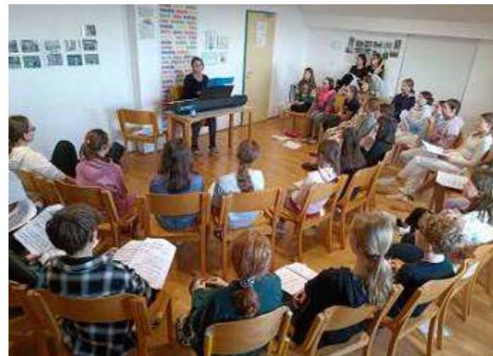
in v učilnici.