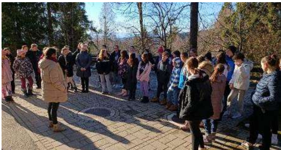
Vaje v naravi