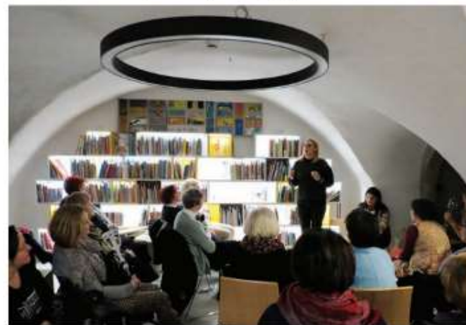
Odraslim so pripovedovale pravljice.