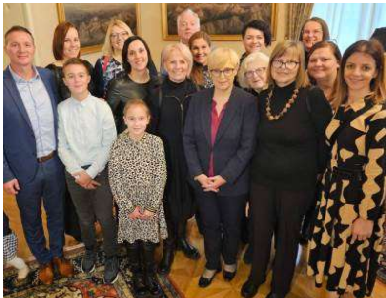
Skupinska fotografija s predsednico države, Natašo Pirc Musar.