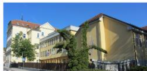
SPREHOD PO FRAMU