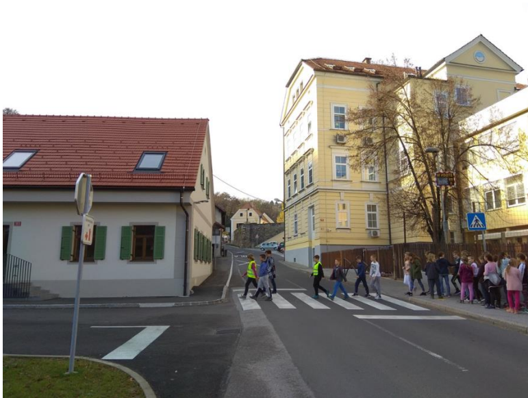
Prehod proti Turnerju

Prometna vzgoja mora postati sestavni del vzgoje pri vseh predmetih, sestavni del priprav na ekskurzije, športne dneve, naravoslovne dneve, kulturne dneve, tehniške dneve in učne pohode. Za varen prihod in odhod učencev so odgovorni starši.